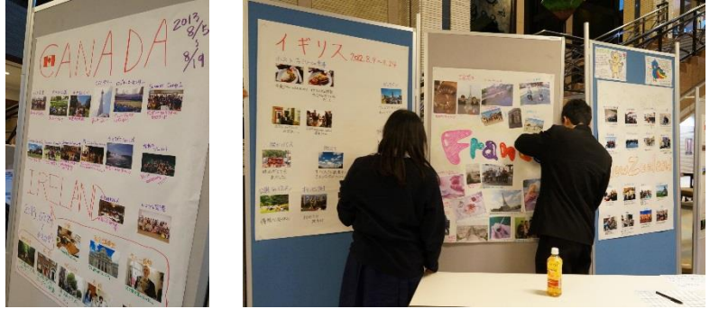
◆生徒主催のHABATAKI写真展