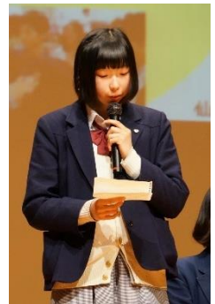
◆支援者の皆様にも多数ご参加いただきました