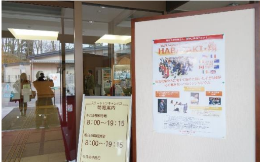
◆東北福祉大の各所に貼って頂いた告知ポスター