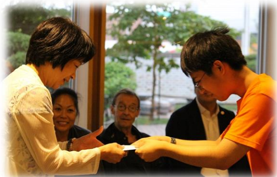
ホストファミリーへの感謝のメッセージ