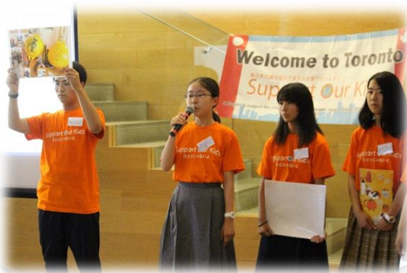
震災プレゼンテーション