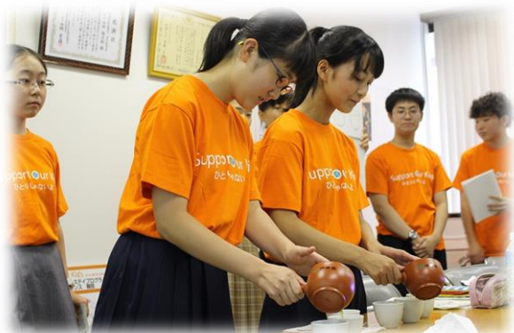
お茶のプレゼンテーション