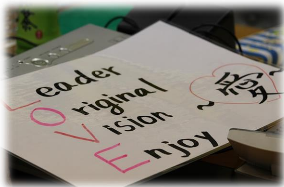
チーム目標の設定