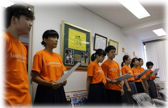
震災プレゼンテーションの練習