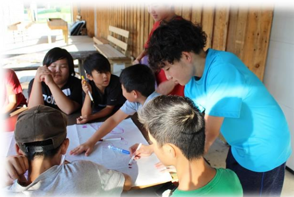
チームアクティビティ