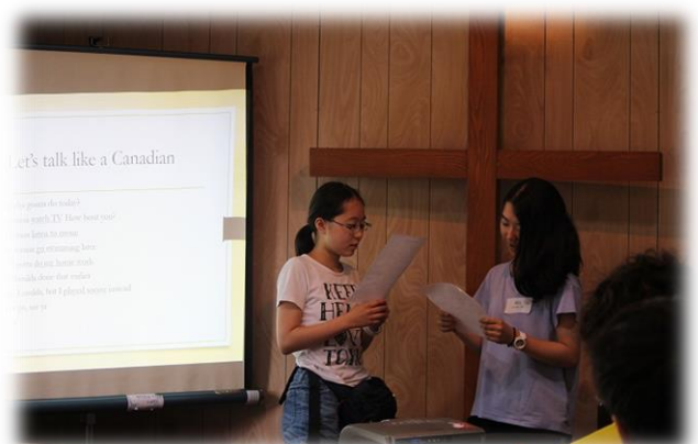
カナダ人の話し方