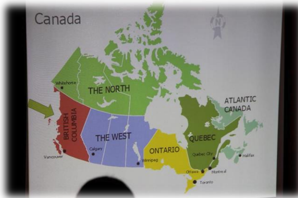
カナダの地理について