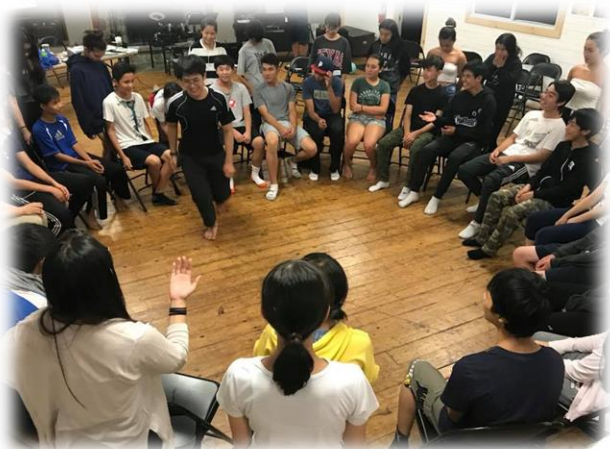
コミュニケーションゲーム