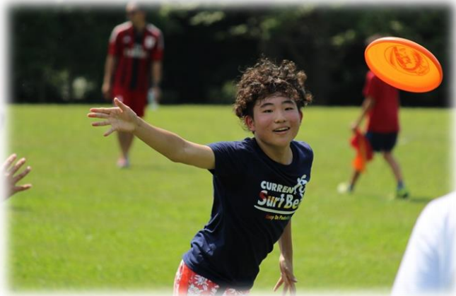
アルティメット フリスビー