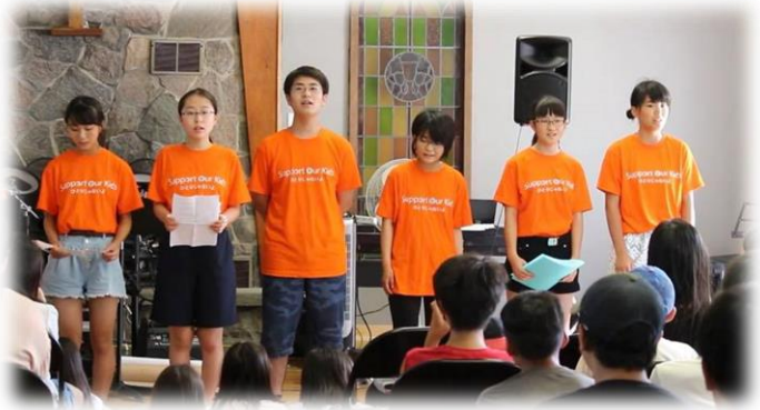
復興支援の歌として知られる「花は咲く」の合唱