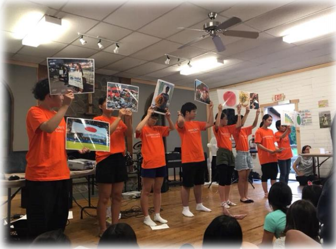
震災プレゼンテーション